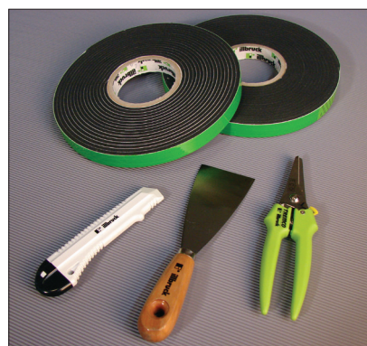
DAFA Flex 600 fogband