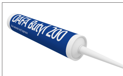
Butyl 200, tub 310 ml.