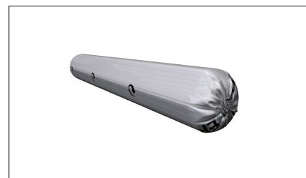
Butyl 200, påse 600 ml.