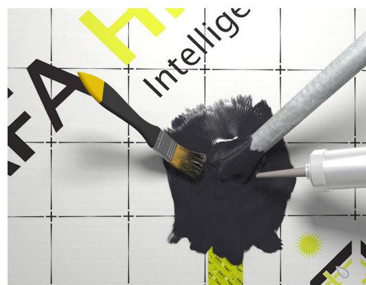
DAFA Hi-tack tetningsmasse til tetning av kompliserte emner.

DAFAs funksjons- og produktgaranti gjelder i 30 år. Det betyr at DAFA påtar seg alle kostnader ved levering, fjerning og montering av produktene som inngår i konstruksjonen.