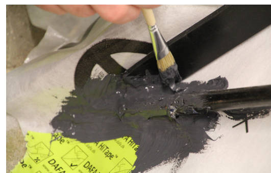
Enkel forsegling av komplekse, små skjøter. Kan pensles og sprøytes.