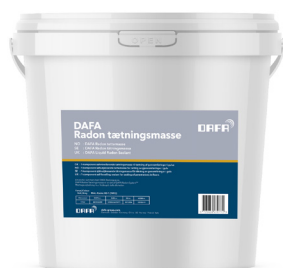
DAFA Radon Tætningsmasse (310 ml. og 5 l.)