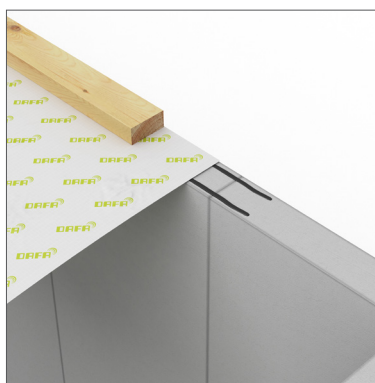
DAFA ExFoil svillemembran - ved yttervegg