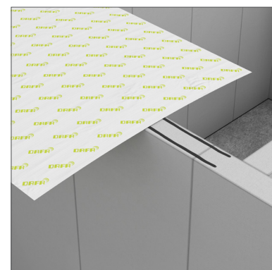
DAFA ExFoil svillemembran - ved innervegg