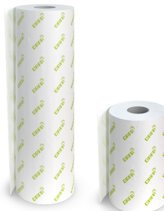
DAFA ExFoil svillemembran. 500 mm eller 1050 mm x 50 m