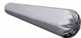
DAFA EPDM High Tack-lim for fugepistol.