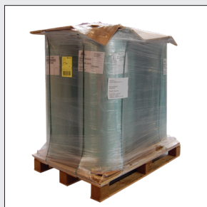
OBS! Opmærkning pr. rl./colli