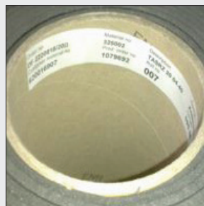
OBS! Opmærkning pr. rl./colli