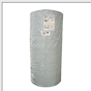
OBS! Opmærkning pr. rl./colli