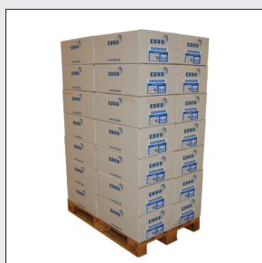
Std. palle 80 x 120 cm