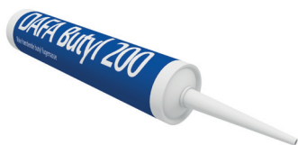
Butyl 200, 310 ml. tube.