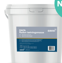
NYHED! DAFA Radon tettemasse, 5 l. spand