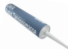
DAFA Radon tettemasse, 300 ml. tube