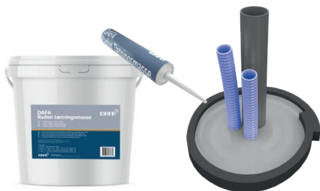
DAFA Radon Tätningssmasse (310 ml. og 5 l spann.) och DAFA Radon Flexibel kant.