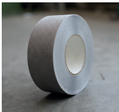
DAFA sparkel and puss tape

Det unike klebestoffet av en akrylblanding, opprettholder god ytelse når det blir utsatt for fukt og damp, og øker dermed den forventede levetiden for tetningen, spesielt på byggematerialer som utsettes for utvidelse og sammentrekninger.