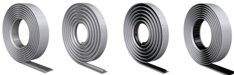
Flere varianter af DAFA butylbånd.