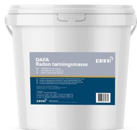
DAFA Radon Tettemasse (310 ml. og 5 l.) og DAFA fleksibel forskaling.