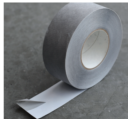
Lineren er delt 50/50