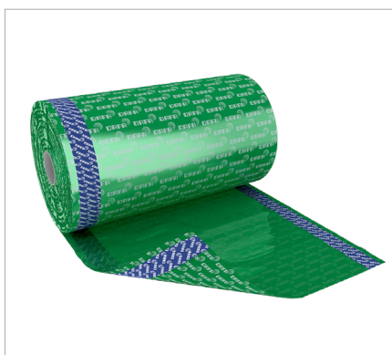
PE lysningsfolie (grøn) med 2 x dobbelt klæb og blå PE lysningsfolie med dobbelt klæb og butyl.

Den grønne DAFA PE lysningsfolie er specielt velegnet til montage på ny eller eksisterende dampspærre, vha. to formonterede baner dobbeltklæbende tape.