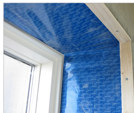
DAFA PE lysningsfolie er CE-mærket efter EU-standard EN 13984.