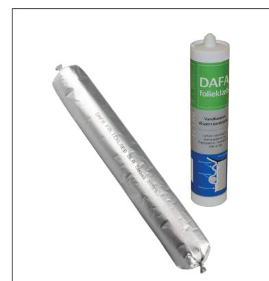
DAFA folielim i 580 ml alu foliepåse och 310 ml tub.